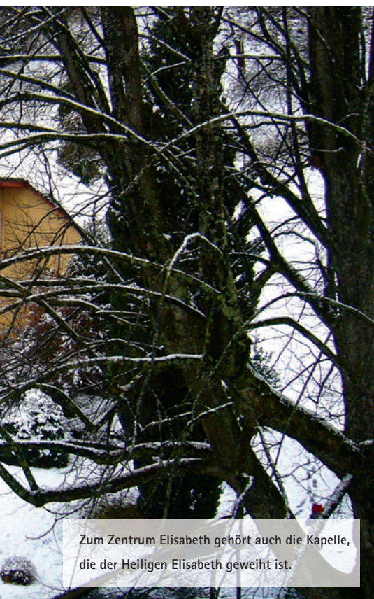
Zum Zentrum Elisabeth gehört auch die Kapelle, die der Heiligen Elisabeth geweiht ist.